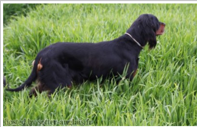
hosted by setter-anglais.fr

2009-03-27 (M) LOF 39486 Dyspl. : C fiche affixe