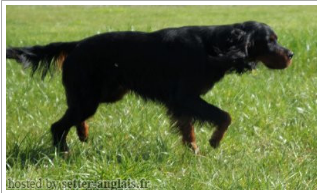
hosted by setter-anglais.fr

2012-02-05 (M) LOF 42038 Titres : TR / Dyspl. : B fiche affixe