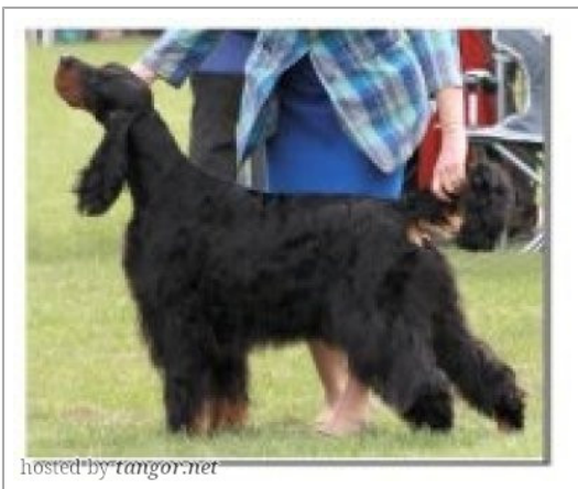
hosted by tangor.net

(F) ANKC-3100182036 Titres : CHAU.B -CHUS.B -CHGB.T / Dyspl. : B fiche affixe