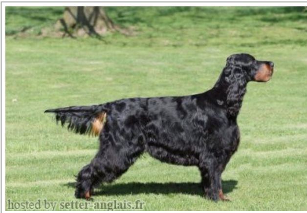
hosted by setter-anglais.fr

2012-08-11 (M) KC-AP03227408-RSH/RISH-9148910 Titres : CHIB CHIE CH.BELG.B CH.BELG.EXPO CH.LUX. Qualifié en FT / Dyspl. : B fiche affixe